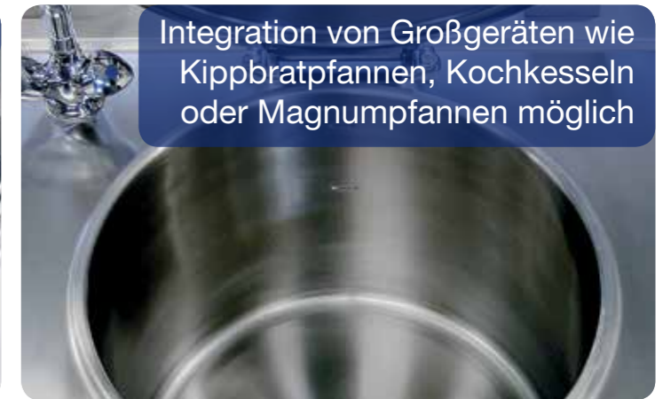
Integration von Großgeräten wie Kippbratpfannen, Kochkesseln oder Magnumpfannen möglich