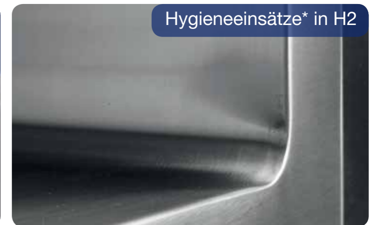
Hygieneeinsätze* in H2