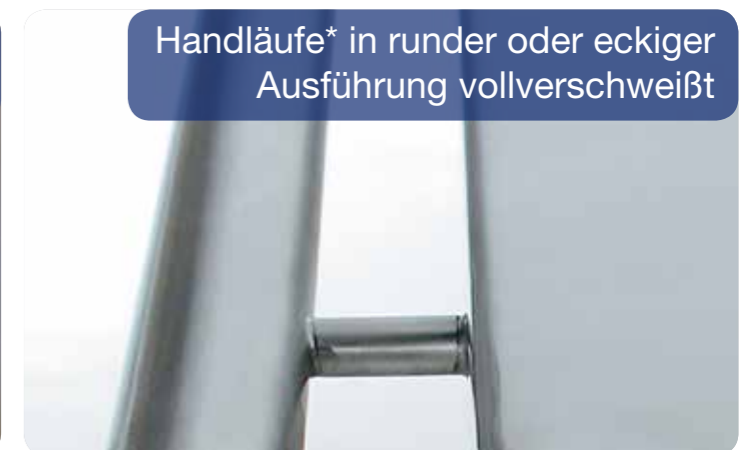
Handläufe* in runder oder eckiger Ausführung vollverschweißt