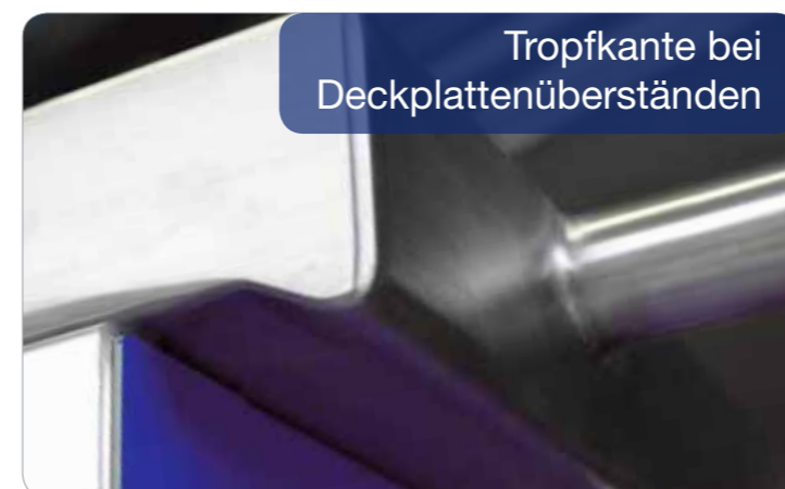
Tropfkante bei Deckplattenüberständen