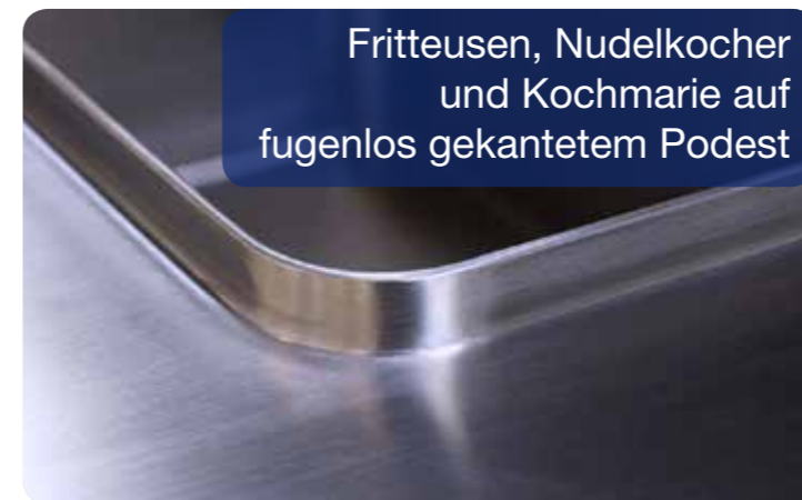
Fritteusen, Nudelkocher und Kochmarie auf fugenlos gekantetem Podest