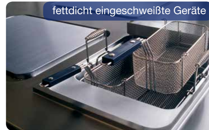
fettdicht eingeschweißte Geräte