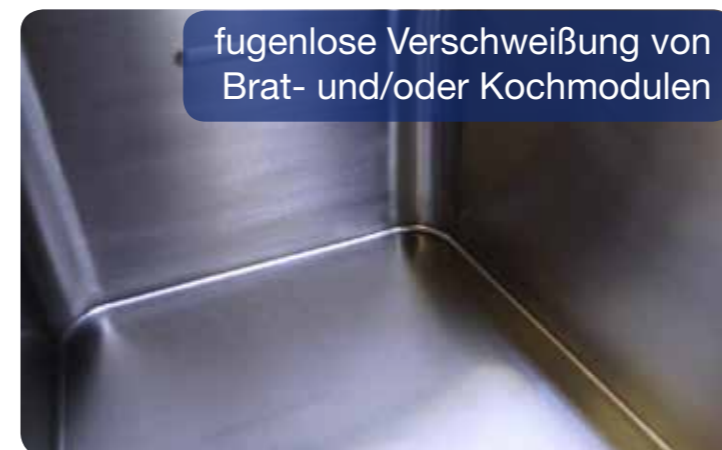
fugenlose Verschweißung von Brat- und/oder Kochmodulen